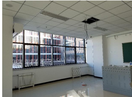
连排玻璃幕墙教室前部