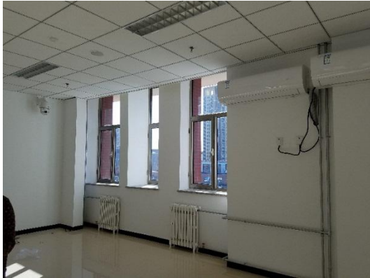
独立窗口教室后部