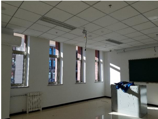
独立窗口教室前部