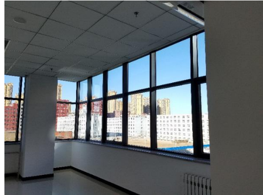
连排玻璃幕墙教室后部